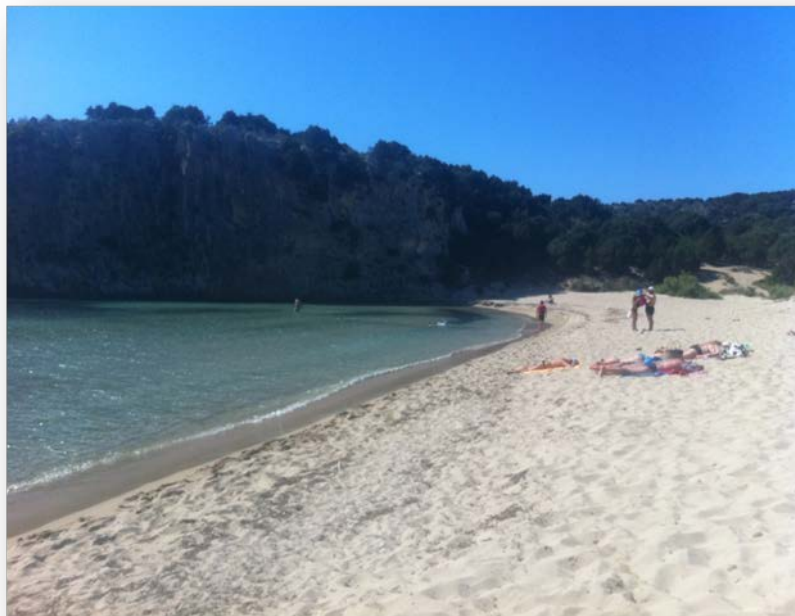
Εικόνα 1. Η παραλία Βοϊδοκοιλιά κατά την καταγραφή πυκνότητας αποσίγαρων.

Η παραλία της Βοϊδοκοιλιάς βρίσκεται στη ΝΔ Πελοπόννησο, βόρεια της Πύλου, ενώ απέχει από την Καλαμάτα περίπου 65km. Ο όρμος της Βοϊδοκοιλιάς περιλαμβάνει μια παραλία με λευκή ψιλή άμμο, μήκους 700m και εύρους 16m περίπου. Μαζί με τη Λιμνοθάλασσα της Γιάλοβας, τον Κόλπο του Ναυαρίνου, τη Νησίδα Σφακτηρία και την παραλία Ρωμανού συνιστά το μοναδικό φυσικό τοπίο των υγροτόπων της Πύλου. Η παραλία αποτελεί δημοφιλή τουριστικό προορισμό κατά τους θερινούς μήνες.