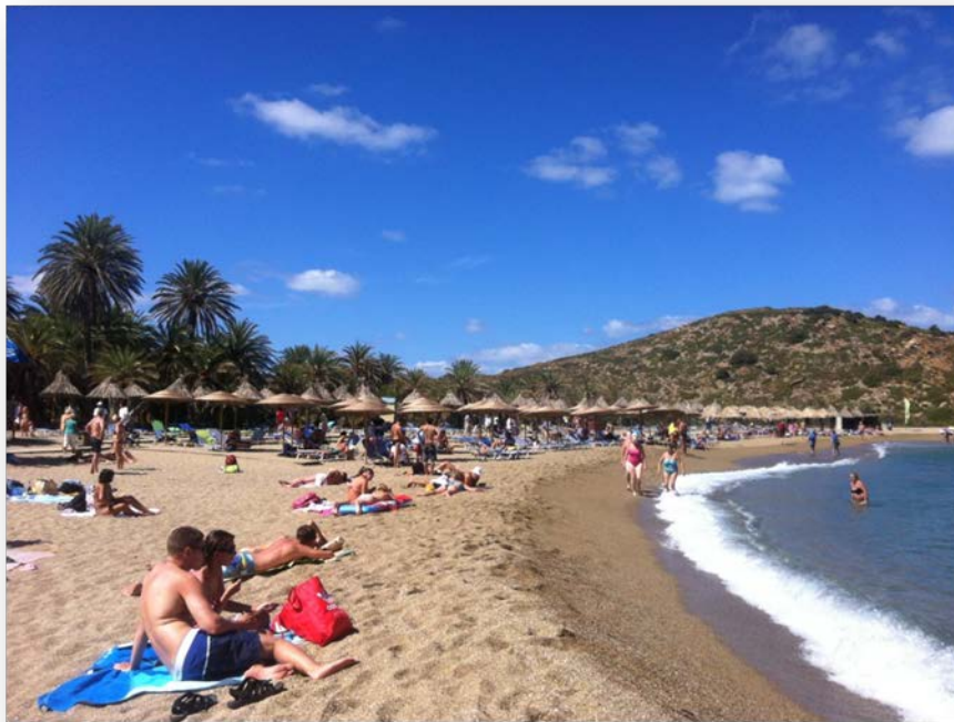
Εικόνα 1. Η παραλία Βάι κατά την καταγραφή πυκνότητας αποτσίγαρων.

Το Βάι βρίσκεται στα ανατολικά παράλια της Κρήτης, και είναι παγκοσμίως γνωστό σαν τη μοναδική παραλία της Ευρώπης με τους φοίνικες νάνους. Το φοινικόδασος στο Βάι αποτελεί έναν από τους πιο δημοφιλείς τουριστικούς προορισμούς της Κρήτης και έτσι η παραλία δέχεται σημαντικό αριθμό επισκεπτών κατά τους καλοκαιρινούς μήνες. Στην παραλία υπάρχει εστιατόριο, καθώς και ξαπλώστρες και ομπρέλες σε περιορισμένη έκταση. Η πρόσβαση επιτρέπεται από την ανατολή μέχρι τη δύση του Ηλίου και, αντίστοιχα, απαγορεύεται η προσέγγιση οχημάτων και η παραμονή ανθρώπων στο φοινικόδασος Βάι, κατά τις νυχτερινές ώρες.