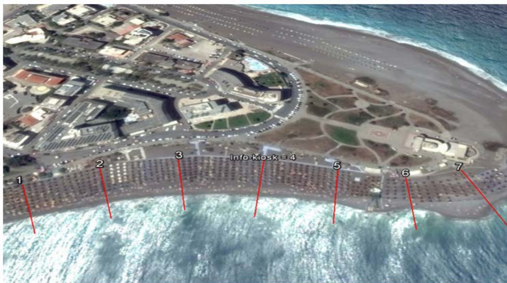
Εικόνα 2. Η παραλία Ενυδρείο κατά την καταγραφή πυκνότητας αποτσίγαρων.

Λόγω περιορισμών σχετικά με την ιδιοκτησία της ακτής και της λήψης άδειας για την εγκατάσταση του ενημερωτικού περιπτέρου (info-kiosk), η καταγραφή και ενημερωτική καμπάνια μεταφέρθηκαν στην παραλία Ενυδρείο.