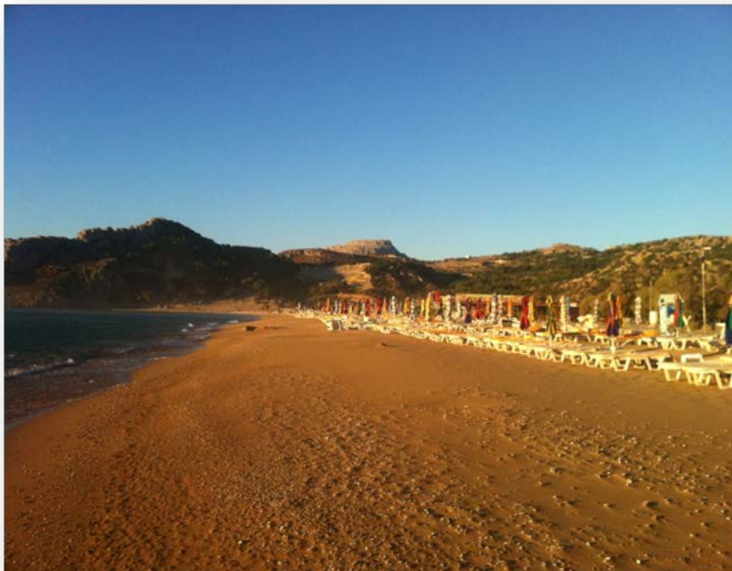
Εικόνα 1. Η παραλία Τσαμπίκα κατά την καταγραφή πυκνότητας αποσιγάρων.

Η παραλία της Τσαμπίκας βρίσκεται στο ανατολικό τμήμα της Ν. Ρόδου, Β.Α. του οικισμού Αρχαγγέλου και απέχει 26km από την πόλη της Ρόδου. Συγκεντρώνει πλήθος επισκεπτών, ιδίως αλλοδαπών, τους καλοκαιρινούς μήνες. Στην παραλία λειτουργούν αρκετές καντίνες, beach bar, εστιατόρια και καταστήματα που λειτουργούν την τουριστική περίοδο (Μάιο - Οκτώβριο). Οι καντίνες τοποθετούν ομπρέλες και ξαπλώστρες στην ακτή, καλύπτοντας το μεγαλύτερο μήκος της έκτασής της. Στην παραλία υπάρχουν αρκετές ήπιες εγκαταστάσεις σε όλο το μήκος της. Ο οικισμός του Αρχαγγέλου πλησίον της παραλίας, αποτελεί έναν από τους μεγαλύτερους οικισμούς της Ρόδου. Περιλαμβάνει μικρά, κυρίως, τουριστικά καταλύματα (ενοικιαζόμενα δωμάτια, διαμερίσματα), καθώς επίσης και εστιατόρια και καφετέριες.