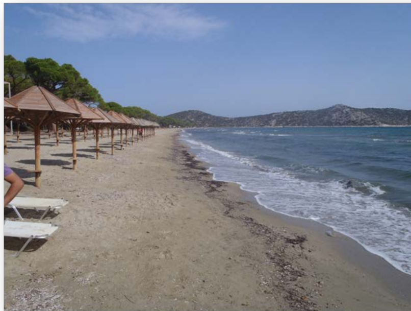
Εικόνα 1. Η παραλία Σχινιάς κατά την καταγραφή πυκνότητας αποτσίγαρων.

Η παραλία του Σχινιά, που εκτείνεται σε μήκος πολλών χιλιομέτρων, βρίσκεται στη Β.Α. Αττική, ανατολικά του οικισμού του Μαραθώνα και απέχει 50km από το κέντρο της Αθήνας. Διοικητικά ανήκει στο Δήμο Μαραθώνα. Η περιοχή υλοποίησης του Έργου LIFE AMMOS εντοπίζεται στο κομμάτι της παραλίας που βρίσκεται εντός του Εθνικού Πάρκου Σχινιά-Μαραθώνα.