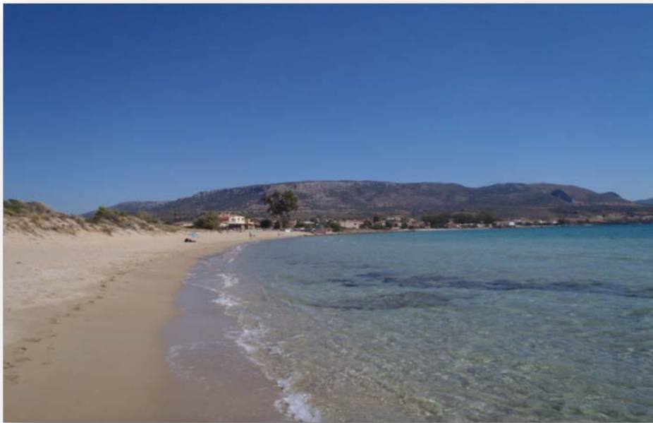
Εικόνα 1. Η παραλία Πλύτρα κατά την καταγραφή πυκνότητας αποσίγαρων.

Η παραλία Πλύτρα/ Παχιά Άμμος βρίσκεται στο εσωτερικό του Λακωνικού Κόλπου, στην άκρη του οικισμού Πλύτρα. Το εύρος της παραλίας κυμαίνεται στα 16m και στο ανώτερο όριό της υπάρχουν θίνες με πλούσια παράκτια βλάστηση. Αποτελεί σημαντικό τουριστικό προορισμό και συγκεντρώνει πλήθος επισκεπτών κατά τους καλοκαιρινούς μήνες. Στον οικισμό της Πλύτρας και του Καραβοστασίου, που βρίσκεται από την άλλη πλευρά της παραλίας, λειτουργούν τουριστικά καταλύματα όλων των τύπων (ενοικιαζόμενα δωμάτια και ξενοδοχεία), καθώς επίσης και εστιατόρια και καφετέριες. Επιπλέον, η Πλύτρα διαθέτει λιμάνι για σκάφη αναψυχής. Στην παραλία υπάρχει café-εστιατόριο, που τοποθετεί και ομπρέλες/ καρέκλες στην ακτή, χωρίς όμως να καλύπτει το σύνολο της έκτασής της.