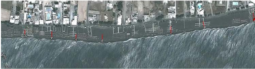
Εικόνα 1. Η παραλία Περίσσα κατά την καταγραφή πυκνότητας αποτσίγαρων.

Η παραλία της Περίσσας, που μαζί με τον Περίβολο αποτελούν μια ενιαία παραλία, βρίσκεται στα Ν.Α. της Σαντορίνης και έχει μήκος 7km περίπου. Πρόκειται για την πιο γνωστή παραλία του νησιού, με μαύρη άμμο και βαθιά νερά. Είναι μια από τις πιο πολυσύχναστες και κοσμικές παραλίες και ιδιαίτερα πυκνοδομημένη. Πέραν της πληθώρας των bar, καφετεριών, εστιατορίων, ξενοδοχείων και λουιτών αντίστοιχων επιχειρήσεων, υπάρχει οργανωμένο κάμπινγκ, και δραστηριότητες όπως καταδύσεις, ιππασία και θαλάσσια σπορ.