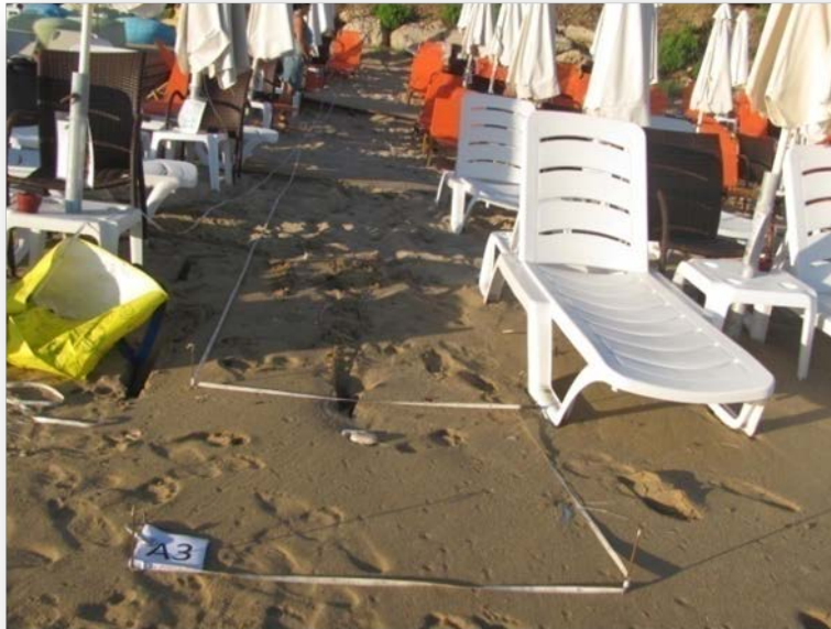
Εικόνα 1. Η παραλία Λούτσας κατά την καταγραφή πυκνότητας αποτσίγαρων.

Η παραλία Βράχου- Λούτσας εκτείνεται σε 3.5km, και βρέχεται από τα νερά του Ιονίου. Βρίσκεται στην Ήπειρο ανάμεσα στην Πρέβεζα (36km) και την Πάργα (25km). Στην παραλία λειτουργούν πολλά beach bars κατά τους καλοκαιρινούς μήνες, που τοποθετούν ομπρέλες/ξαπλώστρες στην ακτή, καλύπτοντας ένα μεγάλο μέρος της έκτασής της. Ακριβώς πάνω από την παραλία υπάρχει δρόμος ιδιαίτερα πολυσύχναστος το καλοκαίρι και πολλές τουριστικές επιχειρήσεις.