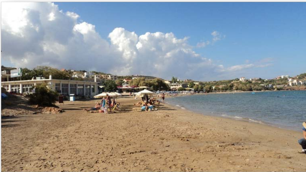
Εικόνα 1. Η παραλία Καρφά κατά την καταγραφή πυκνότητας αποσίγαρων.

Η παραλία του Καρφά βρίσκεται στην πιο ανεπτυγμένη τουριστικά περιοχή της Χίου, σε απόσταση 7km από το λιμάνι. Είναι μια από τις ελάχιστες αμμώδεις παραλίες του νησιού, με πολύ ρηχά και ζεστά νερά. Επίσης, είναι μια από τις λίγες οργανωμένες παραλίες, με καφετέριες, μπαρ και εστιατόρια σε όλο, σχεδόν, το μήκος της. Η παραλία παρουσιάζει έντονες διακυμάνσεις στο πλάτος της που εξαρτώνται τόσο από τους ανέμους, όσο και από τα φερτά υλικά που προέρχονται από δυο ρέματα που εκβάλλουν βορειότερα, προς την πόλη της Χίου. Τόσο στην παραλία, όσο και στην ευρύτερη περιοχή, υπάρχουν πλήθος ξενοδοχείων, μερικά εκ των οποίων είναι από τα μεγαλύτερα του νησιού, και ενοικιαζόμενων δωματίων. Είναι μια από τις πιο πολυσύχναστες παραλίες του νησιού με ντόπιους και ξένους επισκέπτες.