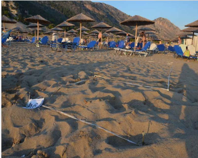
Εικόνα 1. Η παραλία Καλόγριας κατά την καταγραφή πυκνότητας αποσιγάρων.

Η παραλία της Καλογριάς βρίσκεται στη Β.Δ. Πελοπόννησο, 45km δυτικά της πόλης της Πάτρας. Είναι μια αμμώδης παραλία συνολικού μήκους 9km και μέγιστου εύρους περίπου 80m. Στο σύνολό της, πρόκειται για μια από τις μεγαλύτερες παραλίες της Ελλάδας που κατά τους θερινούς μήνες συγκεντρώνει μεγάλο αριθμό επισκεπτών από τα αστικά κέντρα της Β.Δ. Πελοποννήσου, αλλά και τουριστών από χώρες του εξωτερικού. Χαρακτηριστικό της είναι η μεγάλη αμμώδης έκτασή της και η θέα στο Δάσος της Στροφυλιάς, με το οποίο συνορεύει. Στην παραλία υπάρχει beach bar (ξαπλώστρες, ομπρέλες), ενώ το μεγαλύτερο τμήμα της έχει ελεύθερη χρήση.