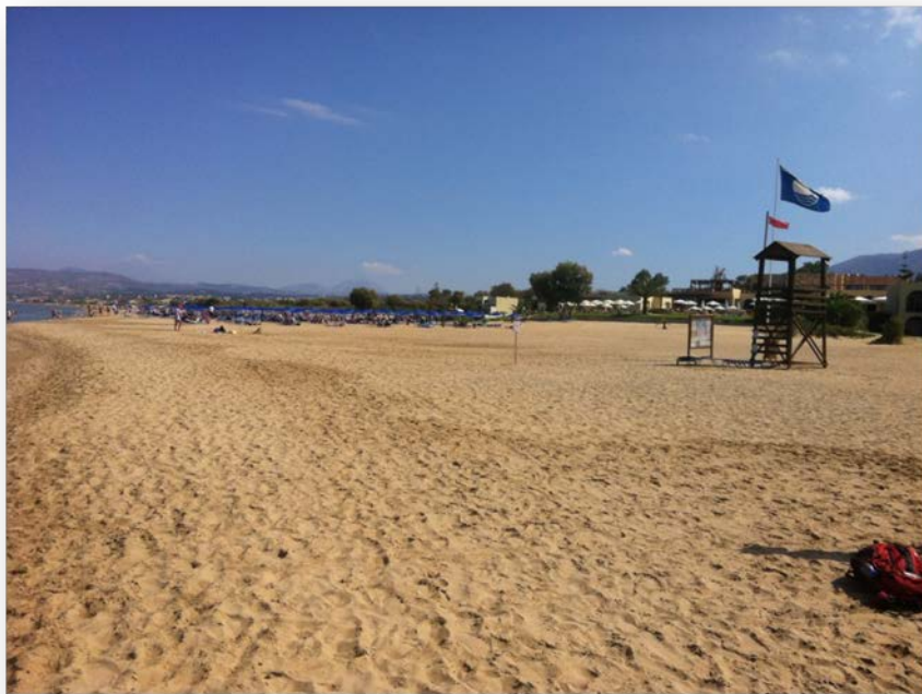
Εικόνα 1. Η παραλία Γεωργιούπολης κατά την καταγραφή πυκνότητας αποτσίγαρων.

Η Γεωργιούπολη βρίσκεται στην Κρήτη και είναι ένα τουριστικό θέρετρο που βρίσκεται 38km ανατολικά των Χανίων και 21km δυτικά του Ρεθύμνου. Είναι μια μικρή παραθαλάσσια κωμόπολη, κτισμένη μέσα σε μια καταπράσινη πεδιάδα, γεμάτη ποτάμια και πηγές. Η κωμόπολη βρίσκεται στο δυτικό άκρο μιας τεράστιας παραλίας μήκους 10km. Πρόκειται για μια πολύ καλά οργανωμένη παραλία, με ξαπλώστρες και ομπρέλες να καλύπτουν μεγάλο τμήμα της.