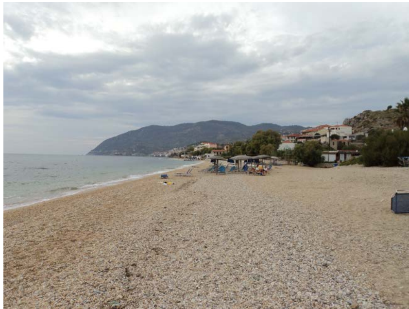
Εικόνα 1. Η παραλία Αγ. Ισιδώρου κατά την καταγραφή πυκνότητας αποτσίγαρων.

Η παραλία του Αγίου Ισιδώρου βρίσκεται πολύ κοντά στο Πλωμάρι στο Δήμο Λέσβου. Σε αντίθεση με τις υπόλοιπες ακτές που συμμετέχουν στο Έργο LIFE AMMOS, ο Αγ. Ισίδωρος είναι μια κροκαλώδης ακτή που επιλέχθηκε ως «μάρτυρας» με στόχο τη σύγκριση των αποτελεσμάτων της με αυτά των αμμωδών ακτών και την- in situ- διερεύνηση του ρόλου της σύστασης της ακτής στη δυνατότητα συγκράτησης αποτσίγαρων. Η παραλία δέχεται σημαντικό αριθμό επισκεπτών, καθώς γειτνιάζει με το Πλωμάρι, σημαντικό τουριστικό προορισμό. Στην ευρύτερη περιοχή, αλλά και πάνω από την παραλία, υπάρχουν ξενοδοχεία, εστιατόρια, καφετέριες, κ.ά..